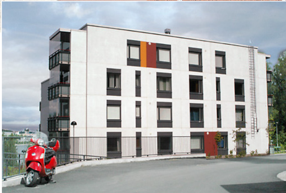
Kylmänoro, happopesty valkobetoni. Värilliset osat maalattuja.

Maalit, ohutpinnoitteet, lasuuri, keeramiset laatat, tiililaatat ja luonnonkivi ovat saatavilla olevia pintoja.